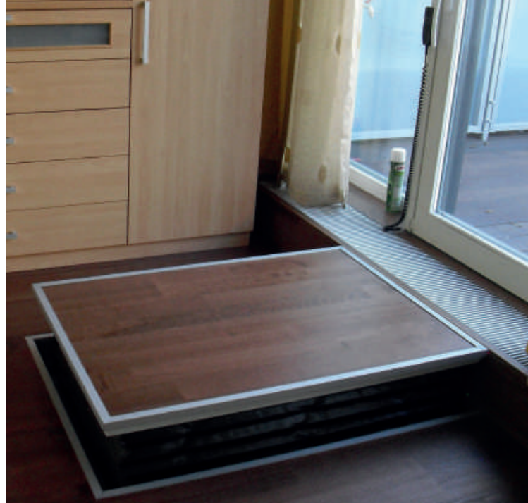
Plataforma en un foso como opción.