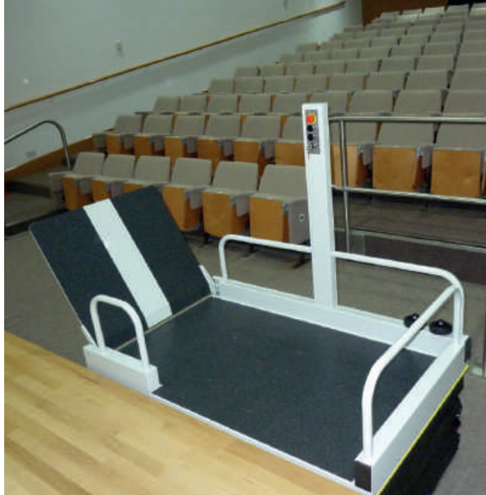
Versión con salida lateral al nivel superior y columna de control