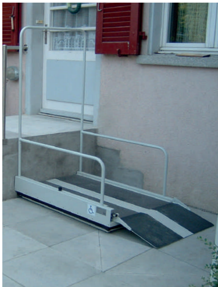
Barandilla de seguridad para la parada superior como opción