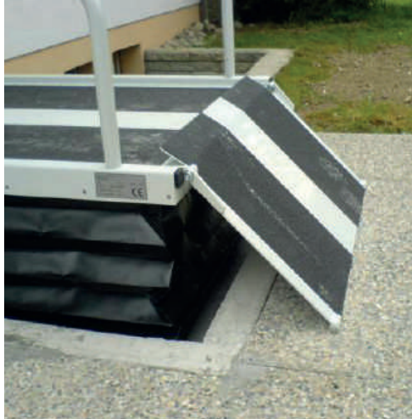
Rampa de acceso mecánico (opcional) como alternativa a la rampa motorizada