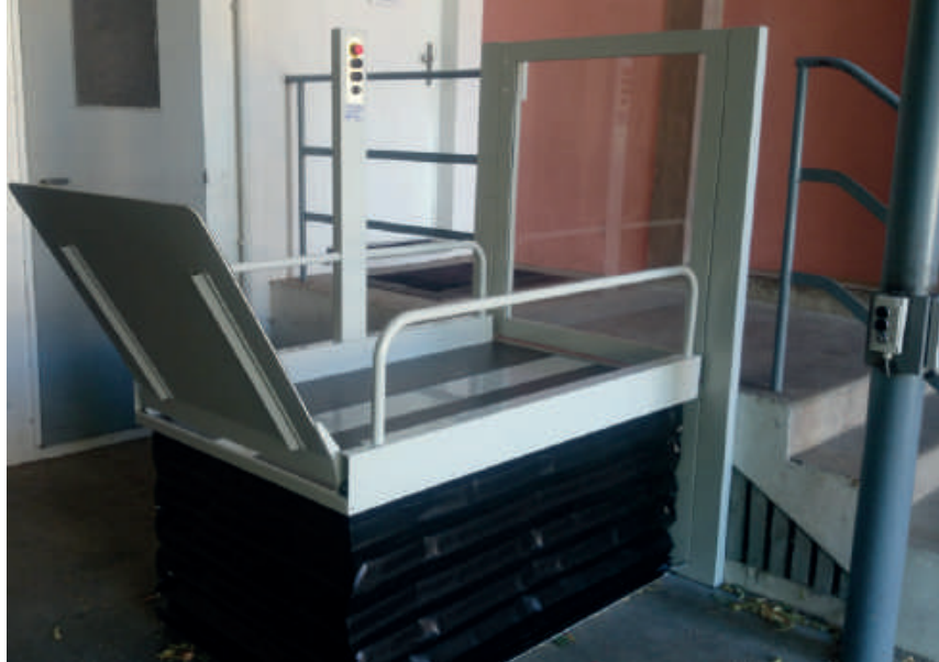
Opción con puerta para la parada superior con cerradura eléctrica