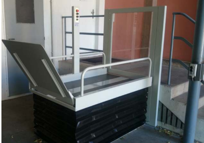
Opción con puerta para la parada superior con cerradura eléctrica