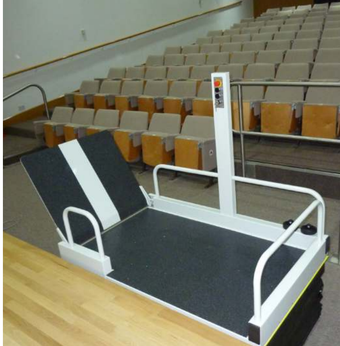
Versión con salida lateral al nivel superior y columna de control