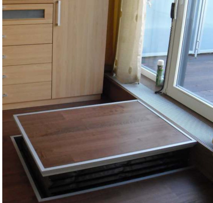
Plataforma en un foso como opción.