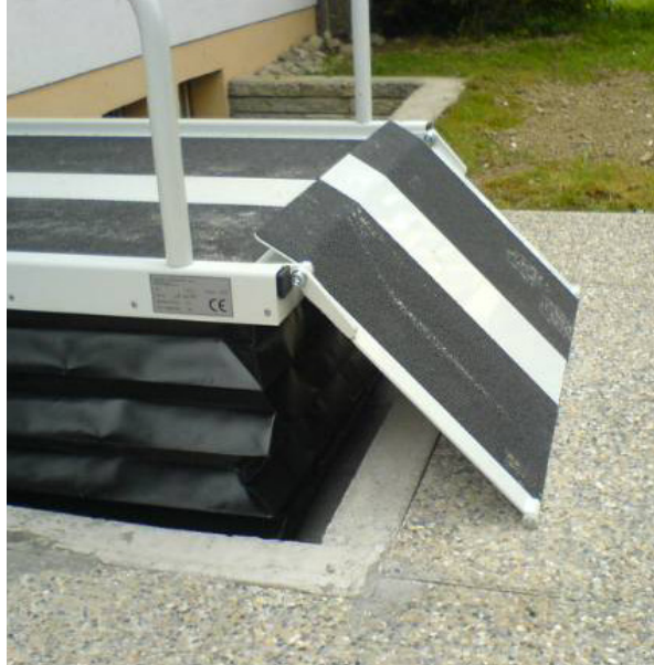
Rampa de acceso mecánico (opcional) como alternativa a la rampa motorizada