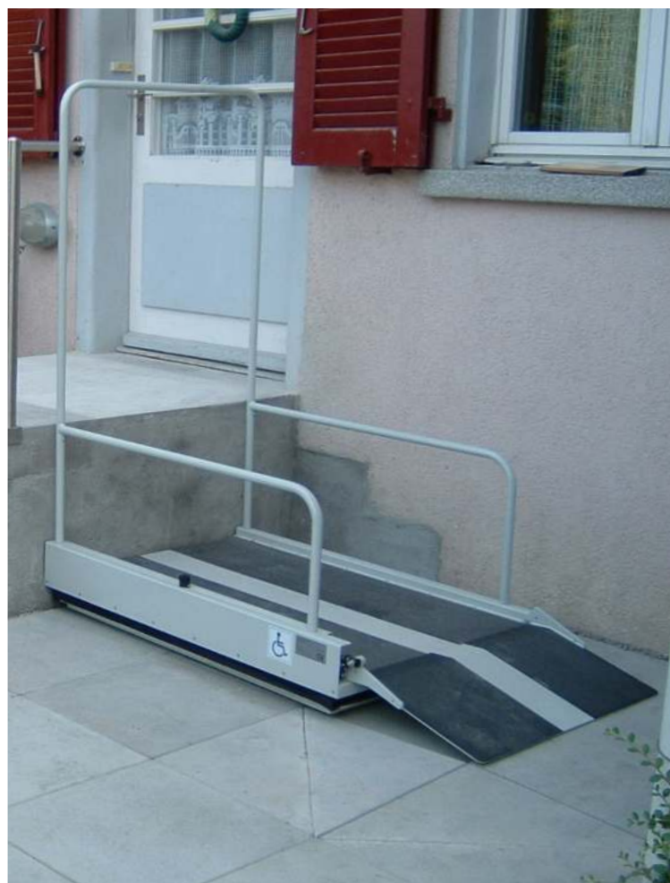
Barandilla de seguridad para la parada superior como opción