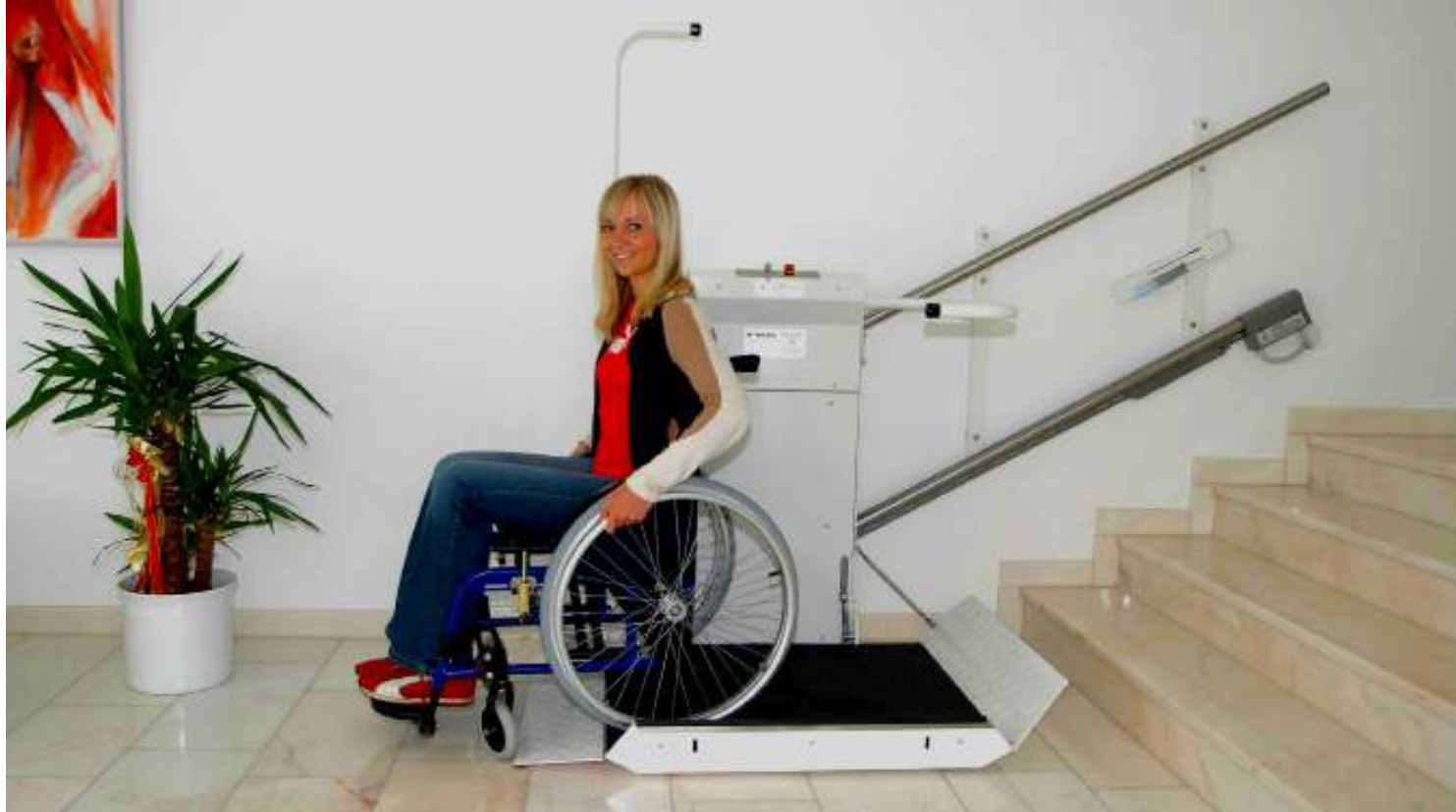
Un plataforma elegante y moderna